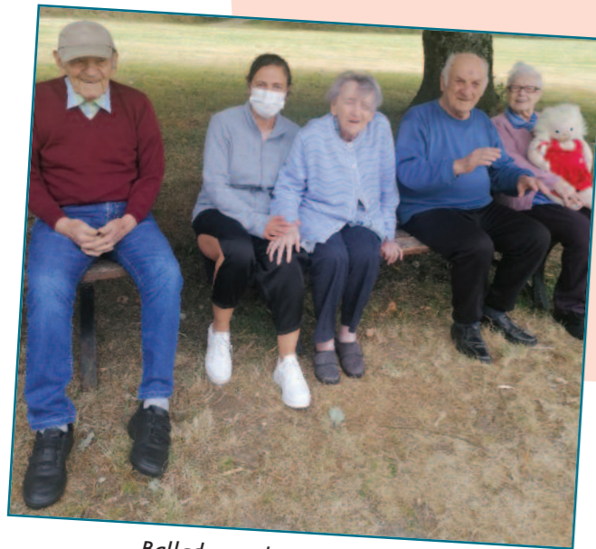
Ballade au plan d'eau de Maël