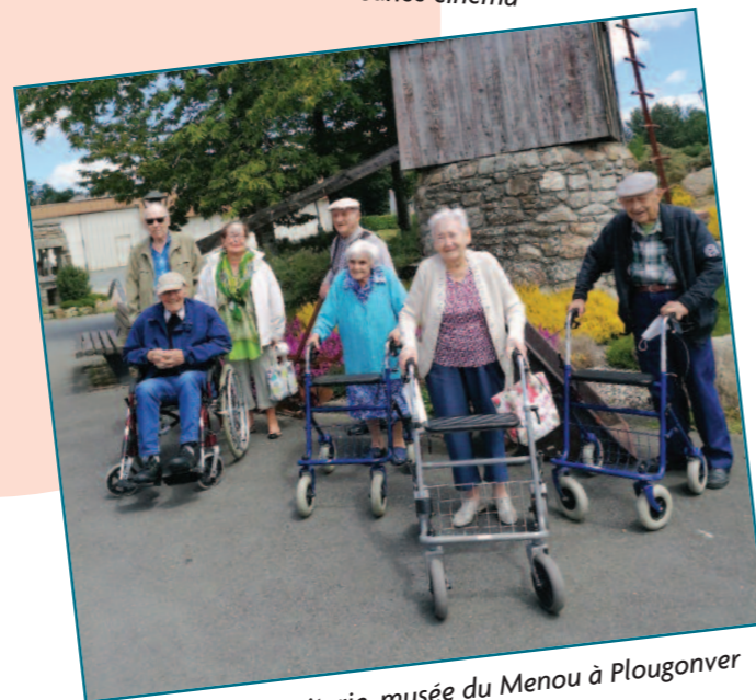
Sortie à la biscuiterie, musée du Menou à Plougonver