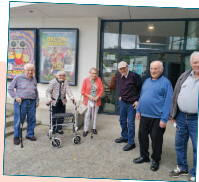
Sortie à une séance cinéma