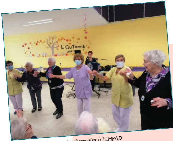
Anniversaire à l'EHPAD