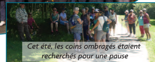
Cet été, les coins ombragés étaient recherchés pour une pause