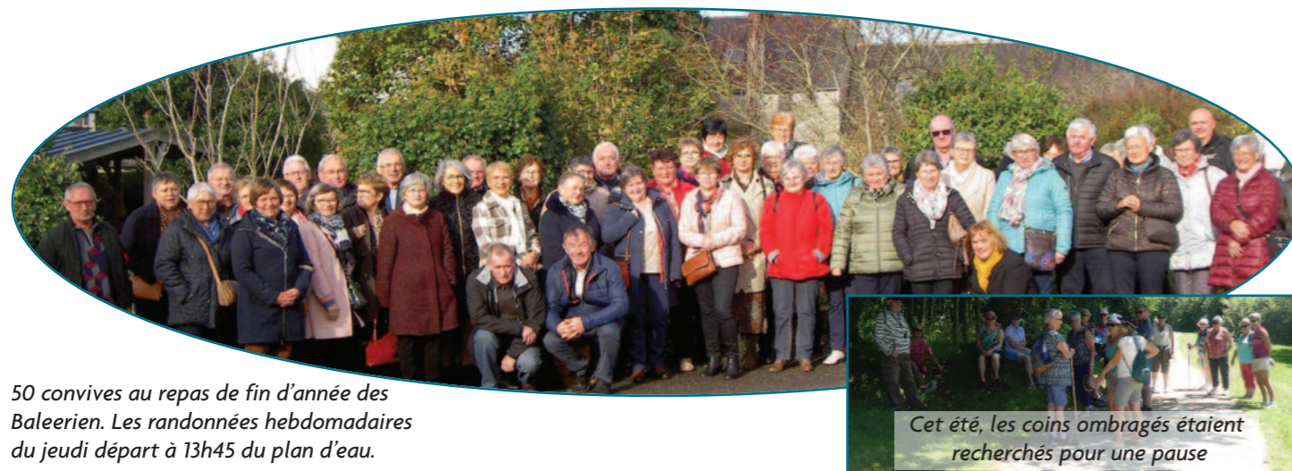
50 convives au repas de fin d'année des Baleerien. Les randonnées hebdomadaires du jeudi départ à 13h45 du plan d'eau.