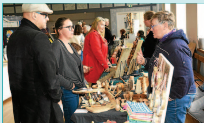
Marché des créateurs