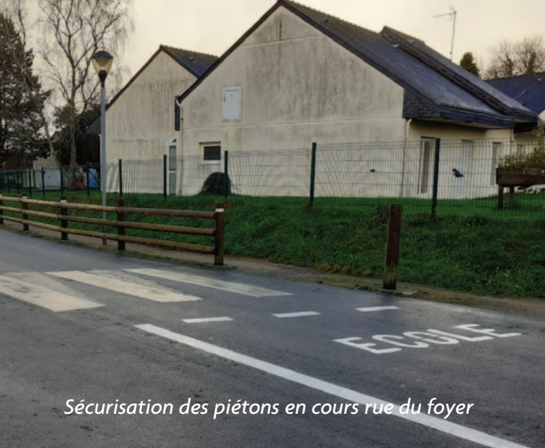
Sécurisation des piétons en cours rue du foyer