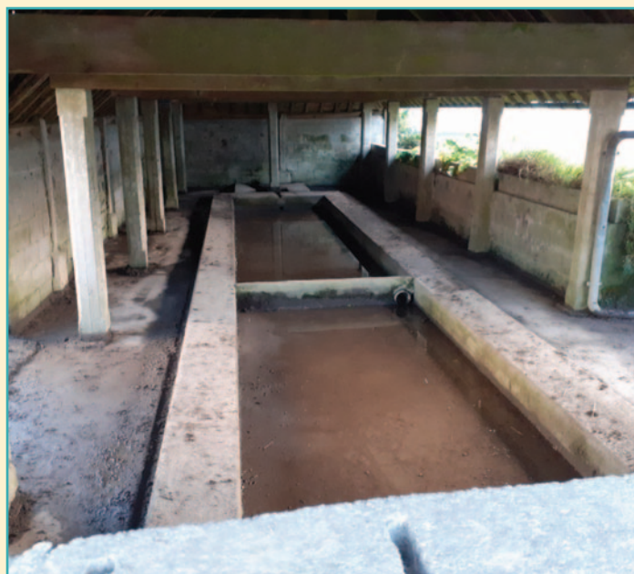
Nettoyage du lavoir de la route de Rostrenen