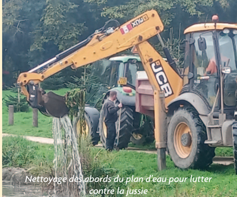
Nettoyage des abords du plan d'eau pour lutter contre la jussie