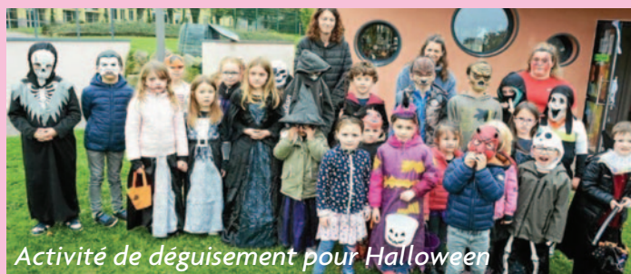
Activité de déguisement pour Halloween

taires, Solex...). Le week-end des 7 et 8 septembre, les passionnés de vieilles calandres et leurs invités étaient accueillis par la municipalité à Maël-Carhaix.