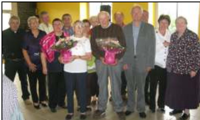
Les doyens de l'assemblée viennent de recevoir un bouquet de fleurs

Le repas, servi par le restaurant des Sources de Maël-Carhaix, s'est déroulé dans une atmosphère joyeuse et a été