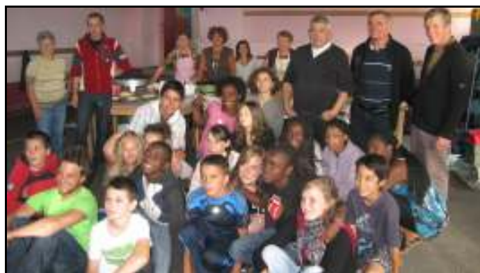
La colonie de Champigny devant les crêpières et les élus

La municipalité, avec le concours de bénévoles, avait tenu à les faire participer à une soirée au cours de laquelle il leur était proposé d'assister à la confection de crêpes traditionnelles de la région avant de les déguster. Cette animation festive fut très appréciée par les jeunes colons qui n'ont pas manqué de remercier chaleureusement les crêpières.