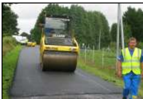
Réalisation de voirie à Goas an Goll

Au cours de l'année 2010, un gros effort a été effectué dans la restauration de la voirie communale. En effet, l'entreprise Brûlé-Weickert a réalisé, pendant l'été, un revêtement en enrobé sur les voies communales de Roc'h an Burtul, de Kerlargan, de Goas an Goll et la portion de route reliant Croissant-Hamonou au Cosquer. Le revêtement en enduit bicouche avait été confié à l'entreprise Héлары qui est intervenue sur la rue du Foyer, Gwazh lin, la route reliant St Quiguenec à Roz ar Suc et la patte d'oie située au carrefour de la route de Lameurette et la D23. Des travaux d'amélioration de la visibilité ont été entrepris par les employés