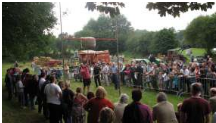
Un lanceur de la botte de paille en plein effort

L'après-midi se terminait par le jeu du lancer de la botte de paille qui voyait s'affronter une douzaine de gros bras de Maël-Carhaix et sa région mais aussi de Champigny .