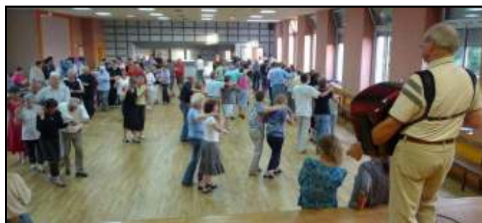
Séance d'initiation aux danses bretonnes