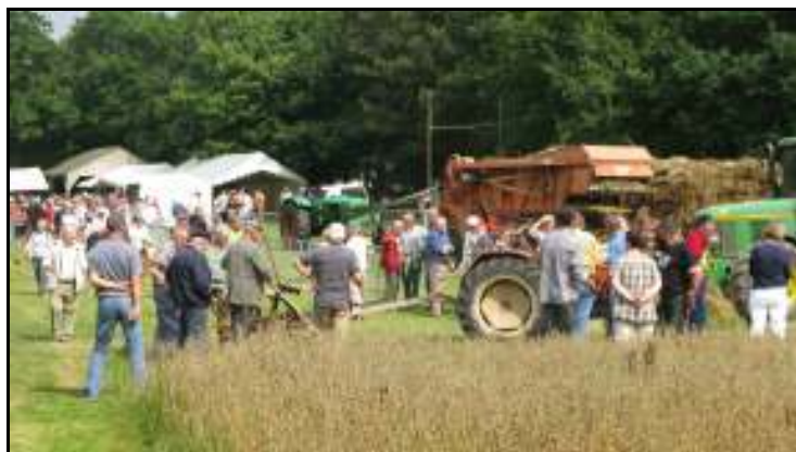
Image de la fête des battages. On s'apprête à faucher l'avoine

La traditionnelle fête des battages s'est tenue le 15 août dernier sur les bords de l'Etang des Sources. Les bénévoles issus de plusieurs associations Maël-Carhaisiennes avaient concocté un programme qui a ravi le millier de personnes présent sur le site. Les spectateurs ont pu voir ou revoir des scènes qui ont disparu depuis bien longtemps. Ainsi, on avait ressorti la faux, la faucheuse et la batteuse, utilisés il y a plus de 50 ans pour les moissons. Des démonstrations de filage de la laine et de tissage étaient présentées ainsi qu'un ensemble de pièces et de documents appartenant à l'association « Ar Mein Glas ». Les danseurs de « Danserien Kreiz Breizh » ont exécuté à plusieurs reprises des gavottes et autres danses traditionnelles du Centre Bretagne. Le cheval et les poneys étaient aussi de la fête et les enfants pouvaient s'adonner aux balades en les chevauchant.