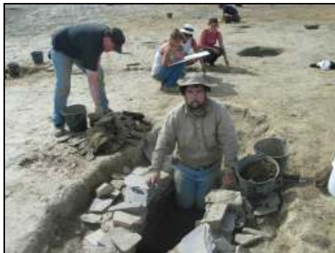
Fouilles archéologiques à Bressilien

Le musée « Ar mein Glas », transféré à la salle de l'Ancienne Ecole a connu un gros succès avec la venue de nombreux visiteurs passionnés par les techniques du travail de l'ardoise et par les photos qui rappelaient à certains des épisodes qu'ils avaient connus