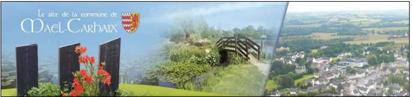
Le bandeau du futur site internet de Maël-Carhaix

Maël-Carhaix devrait disposer d'un site Internet dans les mois à venir. En effet, la commune a fait appel à un prestataire qui a élaboré la trame d'une présentation de 30 pages. Le bandeau principal vous est montré ci-dessus. Ce site permettra de mieux faire connaître notre collectivité en y présentant ses