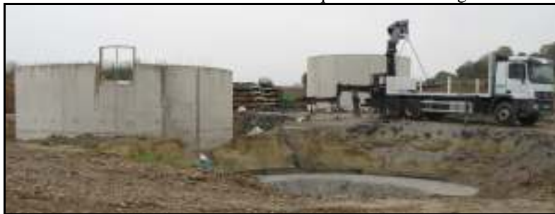
La station d'épuration en construction

Les travaux ont commencé par la mise en place de la saulaie destinée à épurer l'eau rejetée par le clarificateur. La préparation du terrain a été réalisée par l'ETA Le Baron alors que la plantation des saules et la pose des tuyaux d'irrigation ont été menées par