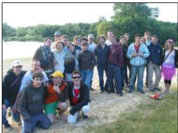
Un groupe de l'association AGR'Raid à l'Etang des Sources